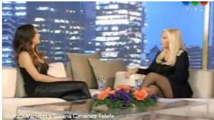
Victoria Vanucci y Susana Giménez Telefe